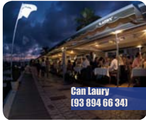
Can Laury (93 894 66 34)