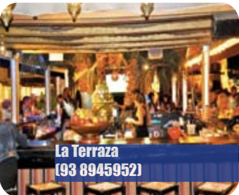
La Terraza (93 8945952)