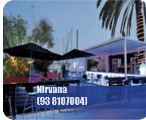
Nirvana (93 8107004)