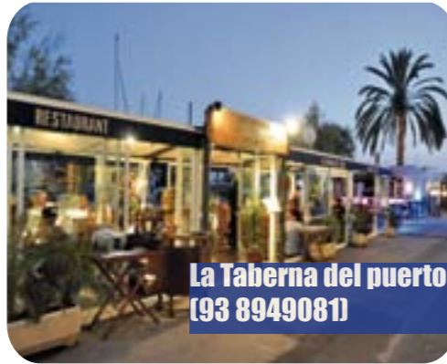
La Taberna del puerto (93 8949081)