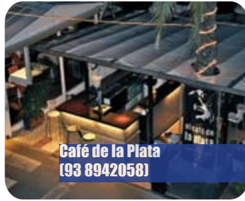
Café de la Plata (93 8942058)