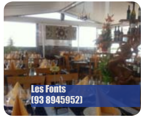
Les Fonts (93 8945952)