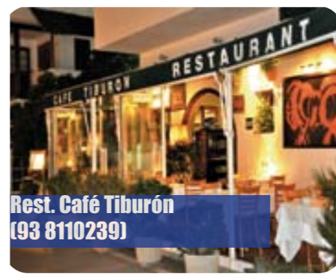
Rest. Café Tiburón (93 8110239)