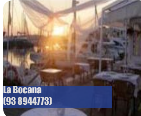
La Bocana (93 8944773)