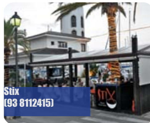
Stix (93 8112415)