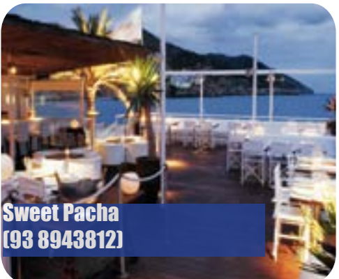
Sweet Pacha (93 8943812)