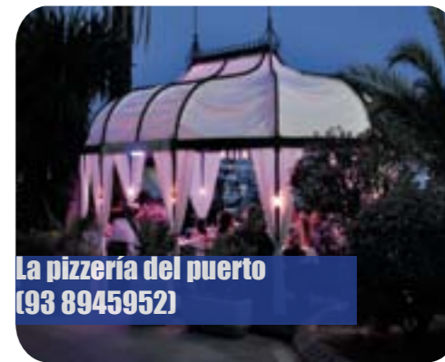
La pizzería del puerto (93 8945952)