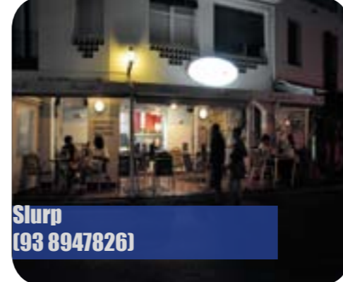
Slurp (93 8947826)